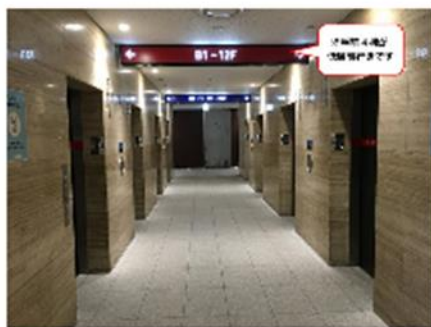
※手前4機が低層階行きエレベーターです。