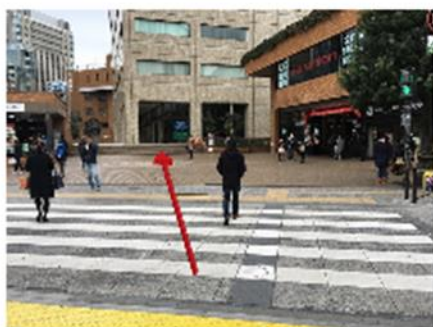
改札を出て正面の横断歩道を渡ります